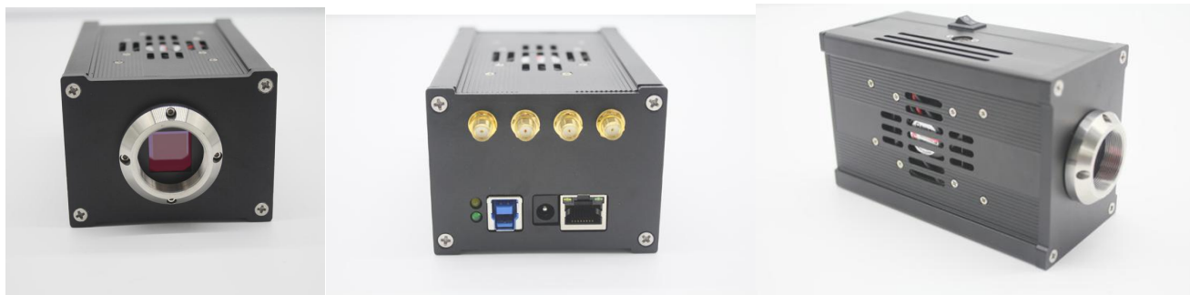
300 万像素彩色/黑白 USB3.0 相机